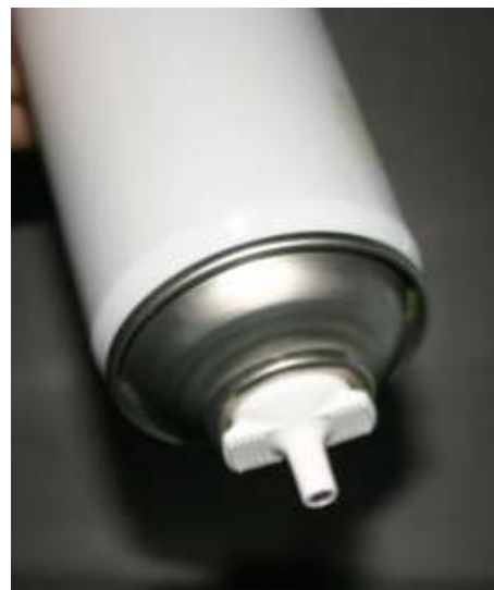
Avec Diffuseur Manuel: bouton poussoir BP63 Adaptable sur certaines machines avec boîtier de 750 ml type 1000